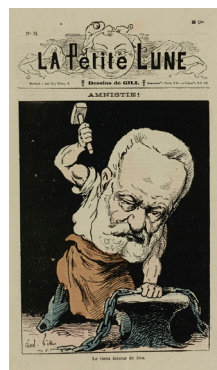
Amnistie. Le vieux briseur de fers, caricature de André Gill dans La Petite Lune, 1879