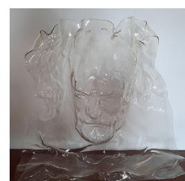
Masque conçu par Caroline Feyt