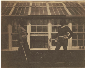
Charles et Victor Hugo en habit d'escrime, Photographie d' Auguste Vacquerie, 1854-1855