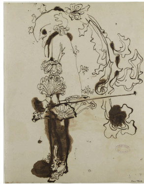
Mousquetaire, dessin de Victor Hugo, 1856-1857