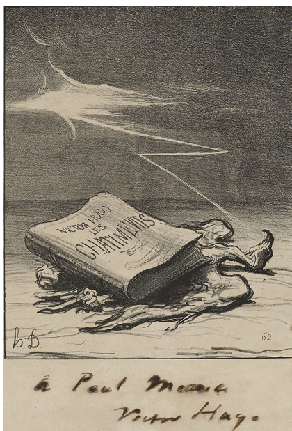
Illustration pour "Les Châtiments" dans l'édition Hetzel Lacroix.