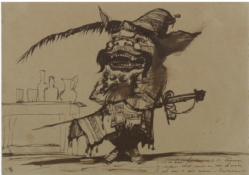
Goulatromba, dessin de Victor Hugo vers 1839

La Maison de Victor Hugo s'associe aux célébrations des Jeux Olympiques de 2024, prenant appui sur la pratique de l'escrime au sein de la famille Hugo pour en dévider un fil symbolique permettant d'évoquer les grands combats de Victor Hugo, les valeurs universelles qu'il a défendues et auxquelles font écho les valeurs de l'olympisme.