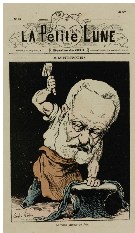
"Amnistie. Le vieux briseur de fers," caricature de André Gill dans La Petite Lune , 1879

Jeune romantique, Victor Hugo rencontre la censure avec l'interdiction de sa pièce Marion de Lorme en 1829. Il sera toute sa vie un ardent défenseur de la liberté, liberté de penser, liberté de la presse et de l'édition, liberté d'aimer aussi. Cet engagement prendra plusieurs formes et se mêlera à d'autres combats tout au long de sa vie politique. Son opposition au Coup d'Etat de Louis-Napoléon Bonaparte condamne le viol de la Constitution garante des libertés civiques. Malgré son désaveu des excès de la Commune, sa lutte pour l'amnistie des communards, dans un souci de réconciliation nationale, est son dernier combat qui le fait apparaître comme « le vieux briseur de fers ».