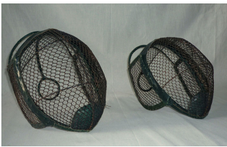
Masques d'escrime de la famille Hugo à Guernesey