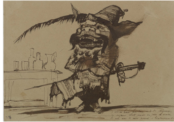
Goulatromba, dessin de Victor Hugo, vers 1839-1840