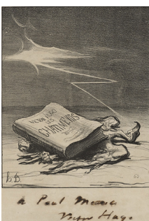
Illustration pour "Les Châtiments" dans l'édition Hetzel Lacroix