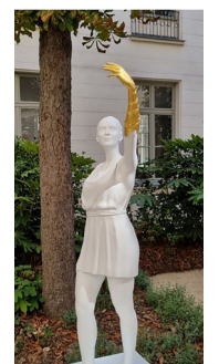
Statue conçue par Stéphane Simon