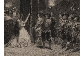
Illustration pour "Marion de Lorme" dans l'Edition Renduel, W. Finden, L. Boulanger, 1836