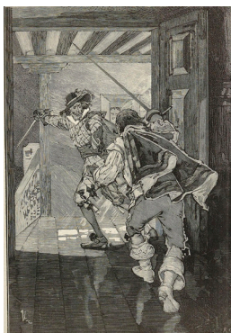
Illustration pour la pièce de théâtre "Ruy Blas", de Victor Hugo, parue dans "Le Monde illustré" du 12 avril 1879