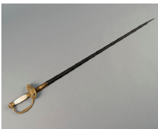
Épée d'académicien de Victor Hugo, avant 1841