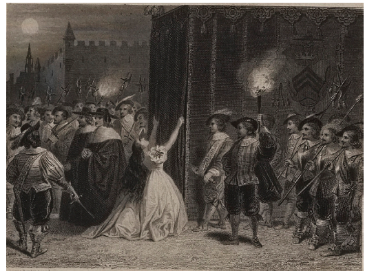
Illustration pour Marion de Lorme , 1836

La présentation prendra comme point de départ une photographie d'Auguste Vacquerie représentant Victor Hugo et son fils Charles, vers 1855, devant la serre de Marine Terrace à Jersey où la famille Hugo est exilée ainsi que des deux masques d'escrime conservés à Hauteville House. Photographies et masques reflètent autant l'un des rares loisirs sur l'île de Jersey pour le père et les fils qu'une allusion politique à une activité combative pratiquée en un temps où le duel politique était encore courant.