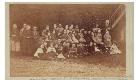
Dîner des enfants pauvres à Hauteville House avec Victor Hugo, photo de Frankland, Henry, 1868, © Paris Musées / Maisons de Victor Hugo Paris-Guernesey