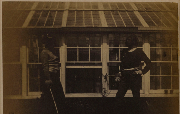
Masques d'escrime de la famille Hugo à Guernesey

La première partie du projet développera ce thème autour des duels évoqués par Hugo dans ses écrits, notamment au théâtre. Puis quatre sections évoqueront les grands combats du poète pour la justice, la liberté, la paix et la fraternité